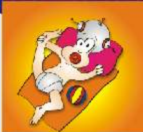
Ο επιθεωρητής "ΤΙ" σε κατάσταση αρχείου

Ο επιθεωρητής ΤΙ κατάφερε πριν από δύο χρόνια να ανακαλύψει το γνωστό πίνακα της Μόνα Λίζα, που είχε κλαπεί από το μουσείο του Λούβρου. Τον βρήκε κρυμμένο μέσα σε ένα κάδο σκουπιδιών! Ο ίδιος βρέθηκε μέσα στον κάδο έπειτα από ένα άγριο ξυλοδαρμό στο μπαρ της «πεινασμένης αγελάδας» όπου του